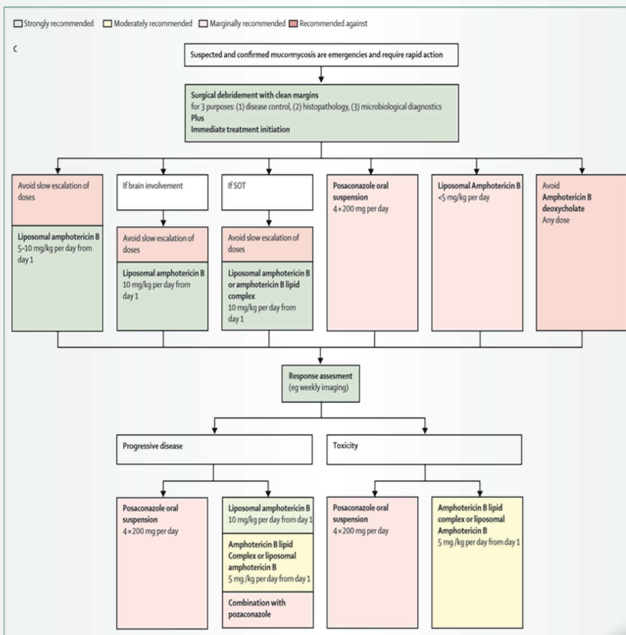
شکل ۱- C. توصیه درمانی موکورمایکوزیس در صورت عدم دسترسی به پوساکونازول و ایساووکونازول تریقی